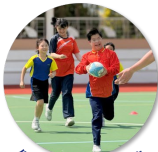
保良百·錦 攬出友情